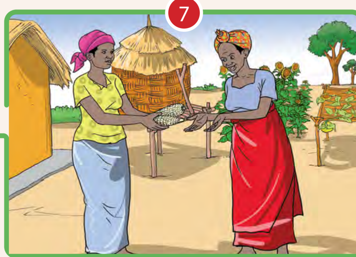
7 RESPECTER LE PATRIMOINE CULTUREL ET TRADITIONNEL