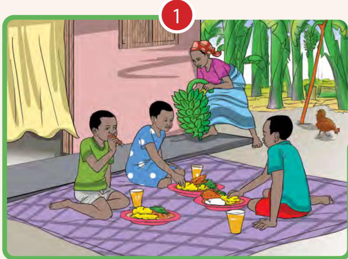
1 CONTRIBUER À LA SÉCURITÉ ALIMENTAIRE ET À LA NUTRITION

CFS-RAI est un cadre volontaire et non contraignant des Nations Unies appliqué conformément au droit national et international en vigueur. Il guide les actions de toutes les parties prenantes engagées dans l'agriculture et les systèmes alimentaires en définissant des principes qui favorisent l'investissement, améliorer les moyens de subsistance et prévenir et atténuer les risques pour la sécurité alimentaire et la nutrition. CFS-RAI s'appuie sur le volontariat Directives sur la gouvernance responsable des régimes fonciers applicables aux terres, aux pêches et aux forêts dans le contexte de la sécurité alimentaire nationale (VGGT) et les Directives volontaires sur la réalisation progressive du droit à une alimentation adéquate dans le contexte de la sécurité alimentaire nationale.