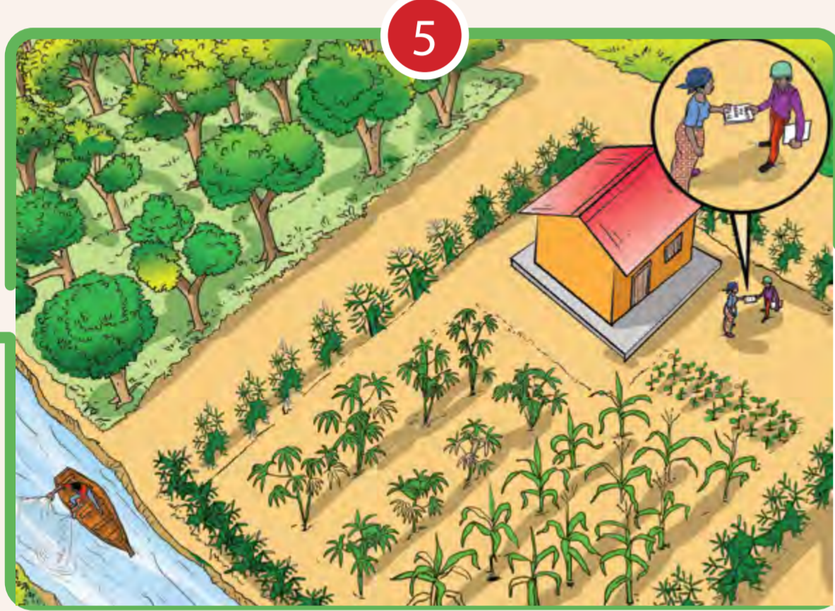
5 RESPECTER LE RÉGIME FONCIER, LA PÊCHE, FORÊTS ET ACCÈS À L'EAU