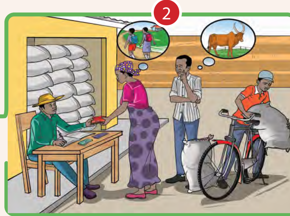
2 CONTRIBUER À UNE ÉCONOMIE DURABLE ET INCLUSIVE DÉVELOPPEMENT ET L'ÉRADICATION DE LA PAUVRETÉ