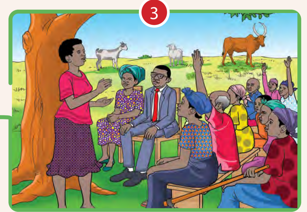
3 FAVORISER L'ÉGALITÉ DES SEXES ET AUTONOMISATION DES FEMMES