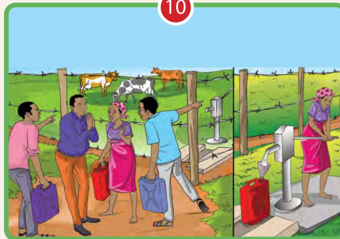
10 ÉVALUER ET TRAITER LES IMPACTS ET PROMOUVOIR LA RESPONSABILISATION

Avis de non-responsabilité : cette publication a été produite avec l'aide de l'Union européenne (UE) dans le cadre du projet " Gouvernance responsable des investissements fonciers " (RGIL) qui fait partie du programme mondial de la GIZ " Politique foncière responsable " en Ouganda, pour favoriser les investissements fonciers qui sont productifs, contribuent à la gestion durable des terres et respectent les droits et les besoins des populations locales, en particulier les femmes et les autres personnes vulnérables. Le contenu de cette affiche relève de la seule responsabilité des développeurs et ne peuvent en aucun cas être considérés comme reflétant les vues de l'Union européenne.