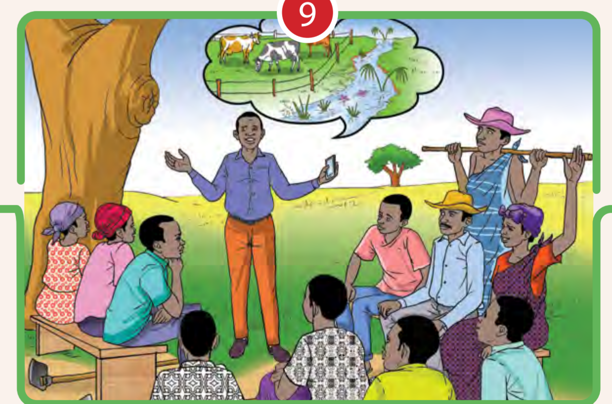
9 INCORPORER DES STRUCTURES DE GOUVERNANCE, DES PROCESSUS ET DES MÉCANISMES DE RÈGLEMENT DES GRIEFS INCLUSIFS ET TRANSPARENTS