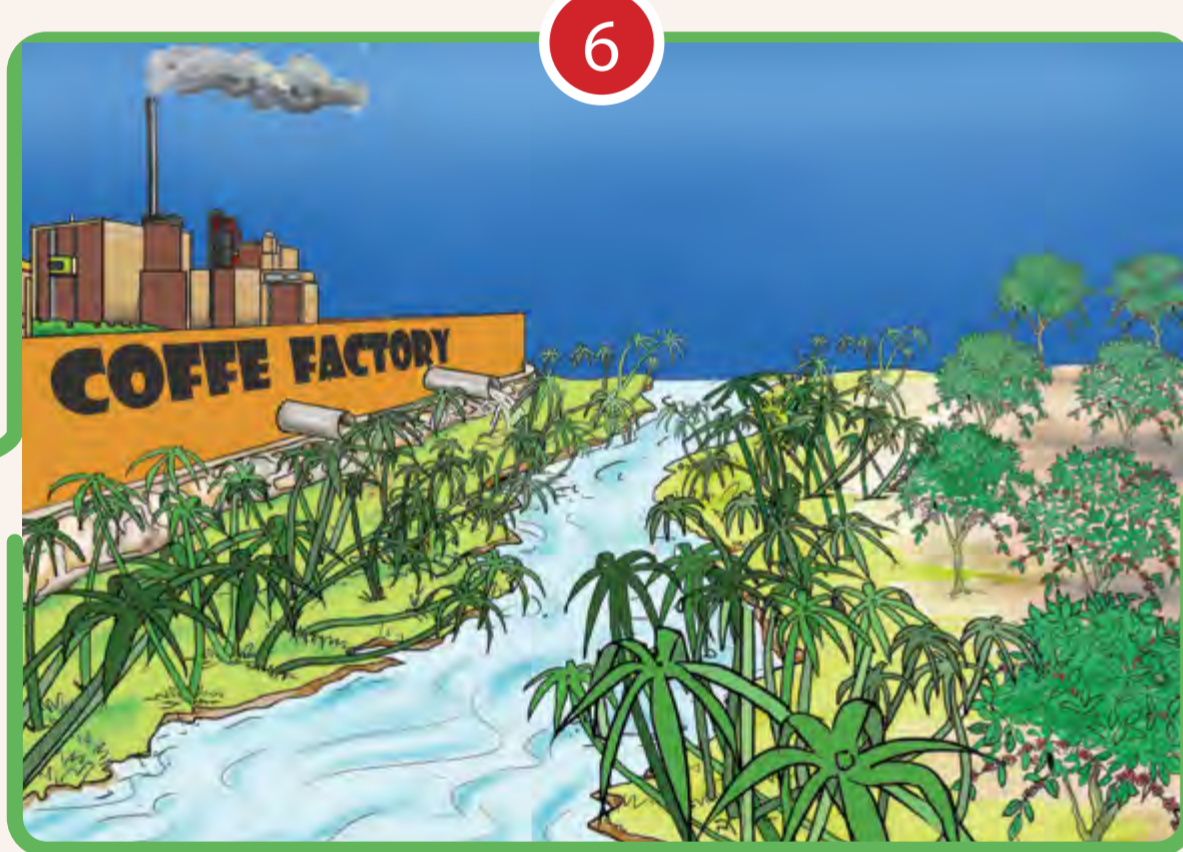
6 CONSERVER ET GÉRER DURABLEMENT LES RESSOURCES NATURELLES, ACCROÎTRE LA RÉSILIENCE ET RÉDUIRE LES RISQUES DE CATASTROPHE